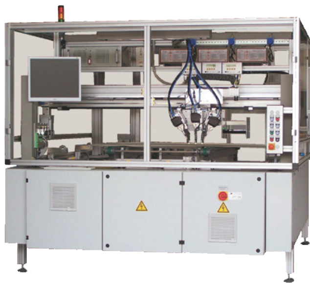
X-BUS: Inline-Lötstation für die Randverschaltung

Je nach Linienkonzept gibt es die Maschine X-BUS in 3 Basisvarianten.