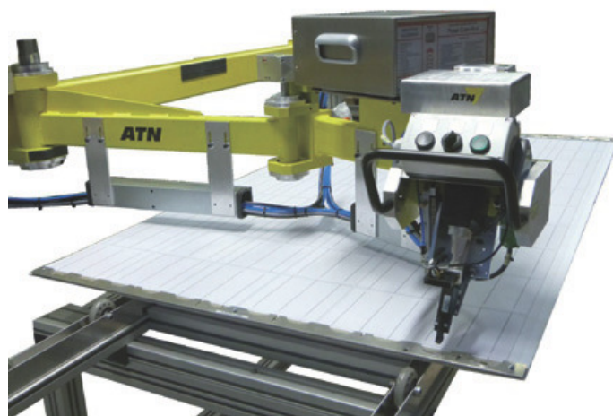
Der Löt Kopf wird mit einem Manipulatorarm positioniert und startet den automatischen Lötprozess

erfolgt das Handling des Löt Kopfes durch den Werker, der qualitätsbestimmende Lötprozess jedoch ist automatisiert und damit reproduzierbar. Der Löt Kopf wird mit einem Manipulatorarm geführt und lässt sich leicht positionieren. Der Induktor ist so angeord-