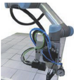
R-BUS: Lötstation mit Sechs-Achs-Roboter

Um das qualitätsbringende Induktions-Lötverfahren auch in kleineren Linien und bei geringerer Investition zu ermöglichen, hat ATN nun die manuelle Lötstation M2-BUS entwickelt. Bei dieser manuellen Lötstation